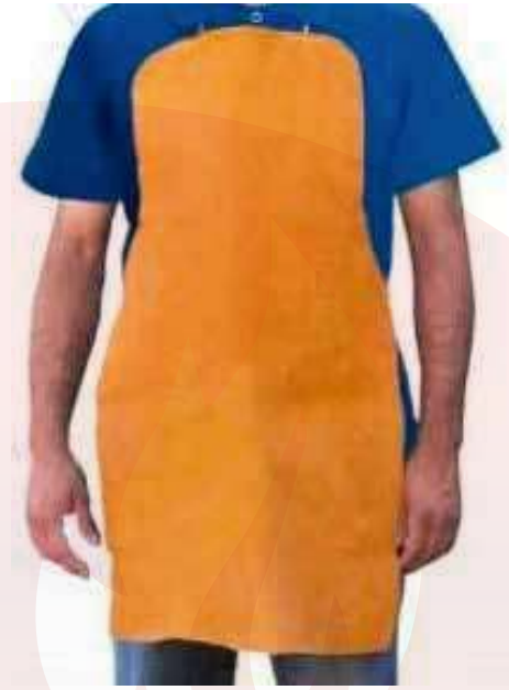
Petos de Carnaza