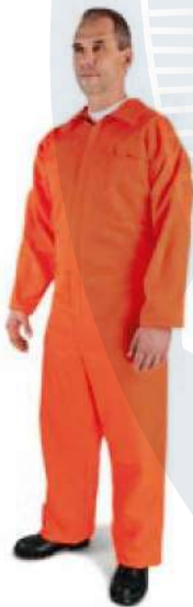
Overol 100% Algodón