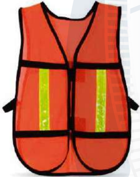
Chalecos de Malla