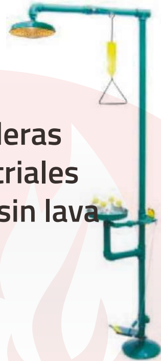
Regaderas Industriales con o sin lava ojos