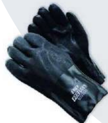
Industrial de Hule