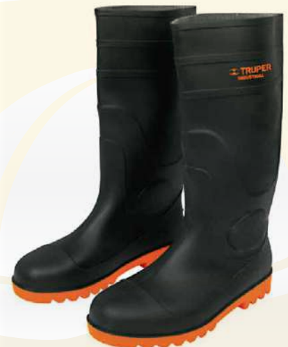
Botas de Hule